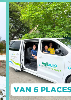
VAN 6 PLACES